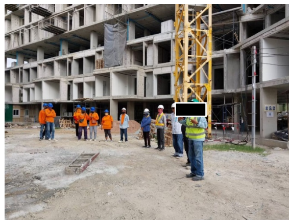
รูปที่ 2-2 แสดงสภาพปัจจุบันของโครงการ ณ เดือน พฤศจิกายน 2565